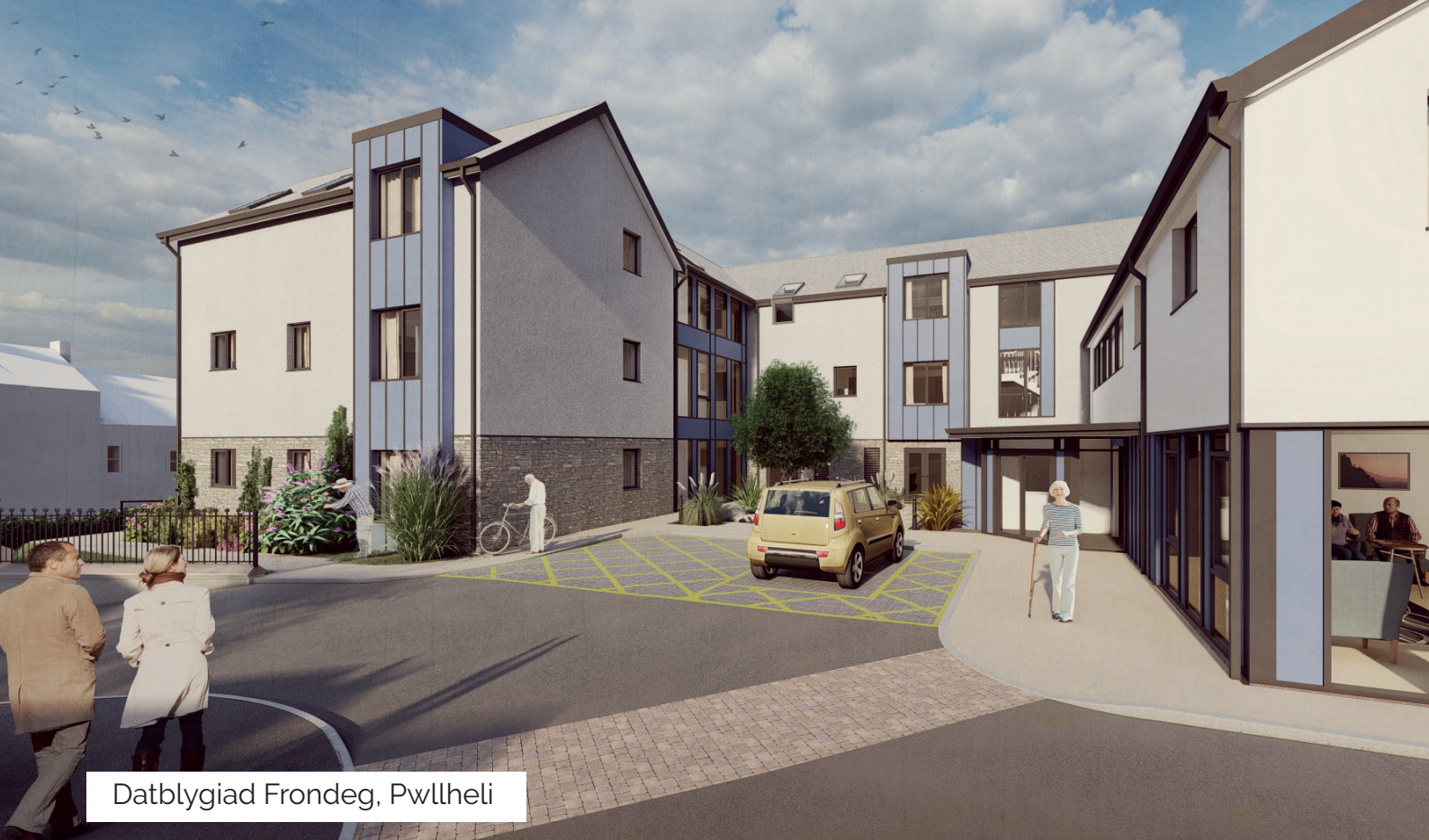
Datblygiad Frondeg, Pwllheli