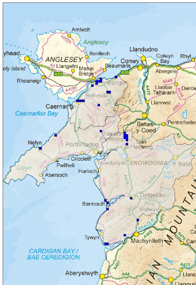
Ffig 4.1 Mannau sydd uwchben y Trothwy Perygl Llifogydd

Pan fydd y rhain ar gael byddant yn darparu rhagor o wybodaeth ar lifogydd dŵr wyneb y gellir ei ddefnyddio i flaenoriaethu buddsoddiad yn yr ardaloedd hynny fydd yn cael y fantais fwyaf.