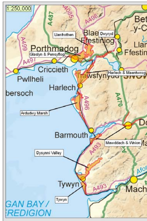
Ardaloedd Draenio Mewnol

Nid oes unrhyw Fyrddau Draenio Mewnol yng Ngwynedd, er hynny mae wyth Dosbarth Draenio Mewnol (DDM) yn y Sir a weinyddir yn uniongyrchol gan Asiantaeth yr Amgylchedd Cymru, sy'n gyfrifol am reoli'r perygl llifogydd o'r holl ffynonellau yn y DDM.