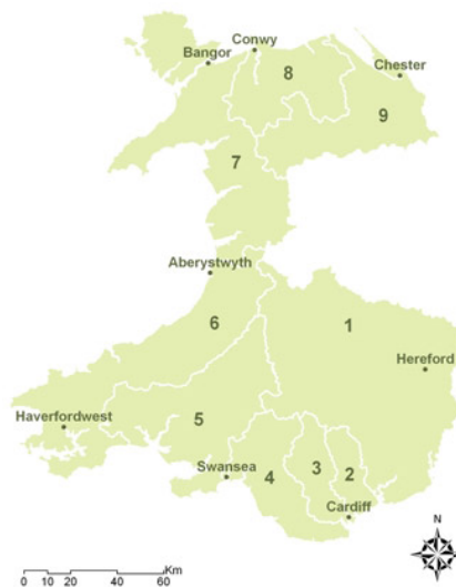
7. Gogledd Orllewin Cymru 9. Afon Dyfrdwy

Mae CRHLLD yn rhannu'r dalgylch i ardaloedd arwahanol ac yn aseinio un o chwe opsiwn polisi i bob un. Mae'r opsiynau hyn yn nodi beth yw'r camau a ffafrir i ddelio gyda pherygl llifogydd ymhob ardal. Rhaid i'r dulliau o gyflawni amcanion y strategaeth hon gyd-fynd gyda'r polisiâu yn y CRHLLD.