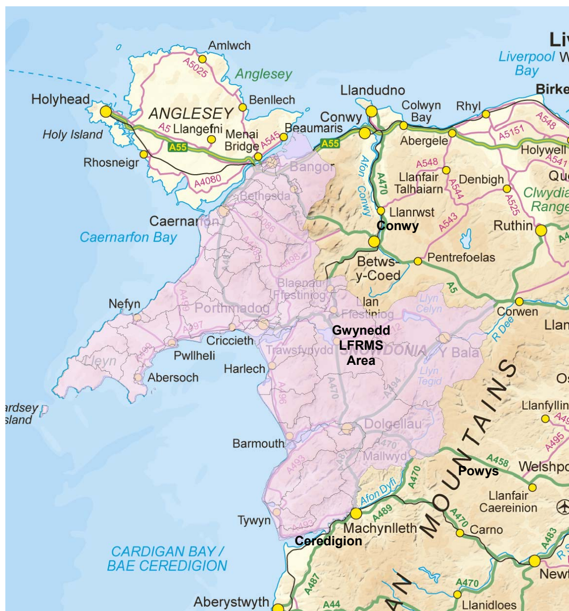
Ffigwr 1: Ardal Astudiaeth